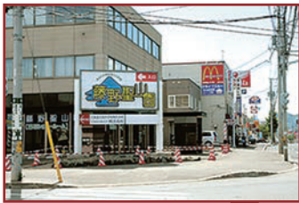
藤野3-2の交差点の看板

札幌市内中心部からの場合、国道230号線（石山通）を定山溪方面へ進み、藤野3-2の交差点を左折。交差点の目印に藤野聖山園の看板があります。