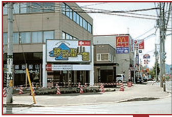
藤野2-2の交差点の看板

札幌市内中心部からの場合、国道230号線（石山通）を定山溪方面へ進み、藤野2-2の交差点を左折。交差点の目印に藤野聖山園の看板があります。