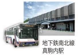
地下鉄南北線真駒内駅

例年 5月上旬～10月下旬の水曜日・土曜日・日曜日・祝日に、地下鉄南北線「真駒内駅前1番のりば」より無料墓参送迎バスを運行しています。